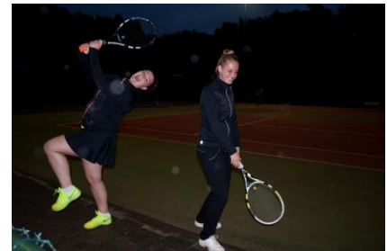
Zij konden vandaag helaas de wedstrijd niet uitspelen