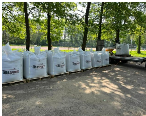
TENNISBANEN 6 & 7